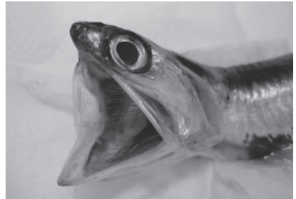
図1 カタクチイワシの大きな口