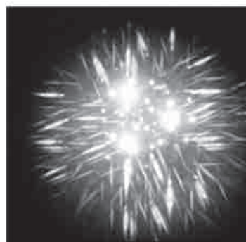
図3 分光シートで観察したLED

URL： https://www.qst.go.jp/site/kids-photon/