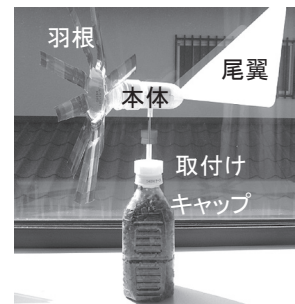
ペットボトル・LED風車