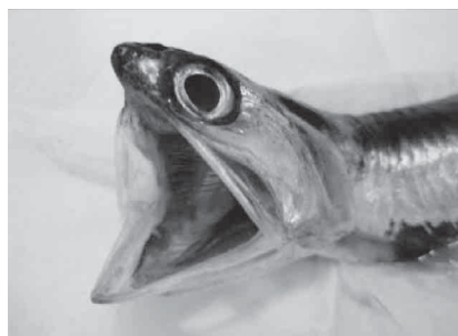
図1 カタクチイワシの大きな口

イワシは、大きな口をあけて入ってくるプランクトンをすべて丸のみしますから(図1)、生きたプランクトンネットといえます。そんなイワシを乾燥させた煮干しのお腹から、よごれた海にすむプランクトンが見つければ、海がよごれているとわかります。遠く離れた海のよごれを、いつでもどこでも観察できます。